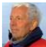
Ausbildungschef CCS Zürich

Abendessen. Auch wenn die Nachfrage in der neuen Kurssaison teilweise etwas geringer ausfallen dürfte, schauen wir doch mit Zuversicht nach vorne.